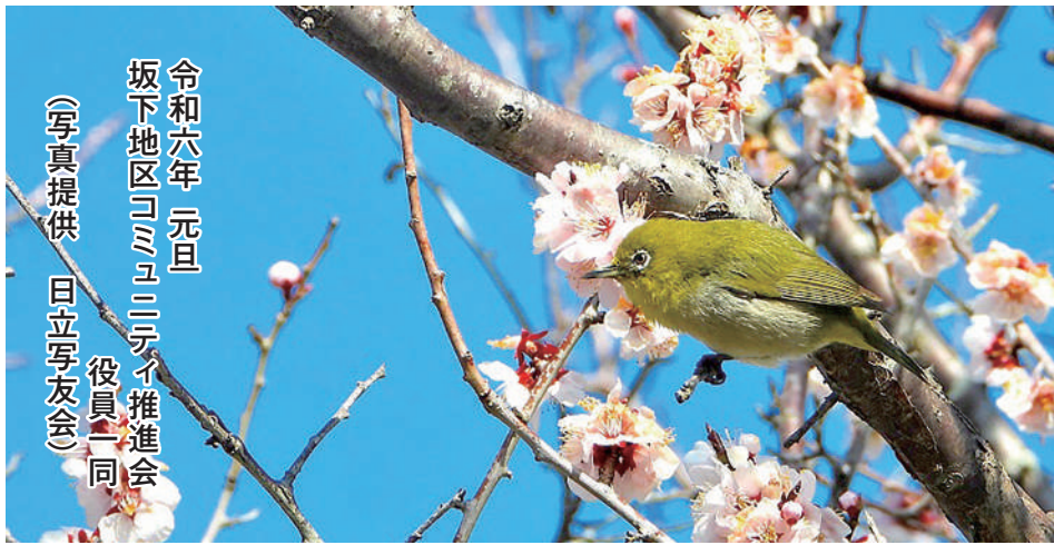
令和六年 元旦 坂下地区コミュニティ推進会 役員一同