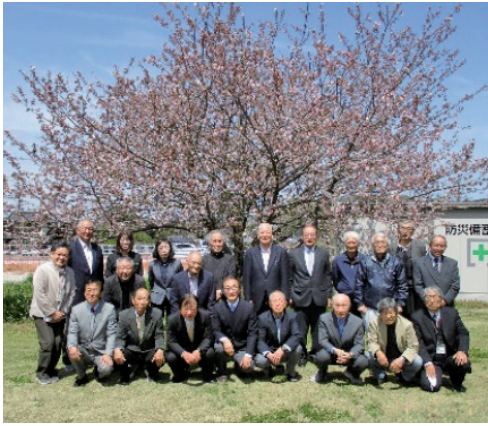
令和6年度役員の皆さん